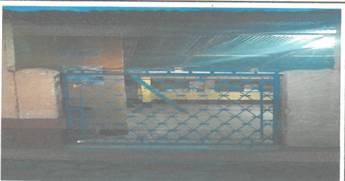
Foto 2.1: Sustrucción de puerta metalica, por portón corredizo tipo enrejado forrado con tubo, base cuadrada de una pulgada y media, en la entrada principal de la escuela.