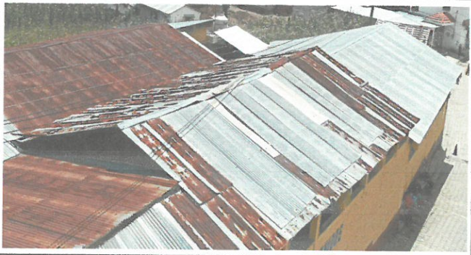
Foto 1.1: Sustrucción de lamina acanalada por lamina troquelada calibre 26 de Aluzinc, sujetado con tornillos autopercorables en el patio de la escuela.