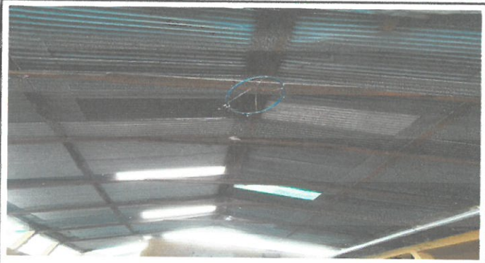
Foto 1.2: Sustrucción de estructura de madera por estructura de metal con vigas de perfil tubular rectangular, en el patio del establecimiento educativo.