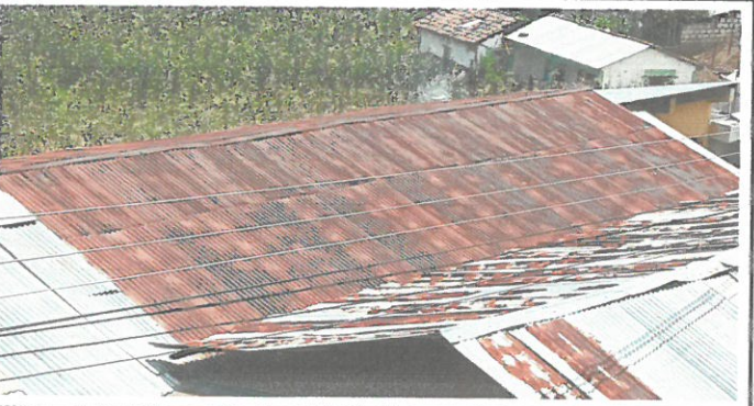
Foto 1.3: Sustrucción de lamina acanalada por lamina troquelada calibre 26 de Aluzinc sujetado con tornillos autopercorables, en el techo de dos aulas ubicadas frente al patio de la escuela.