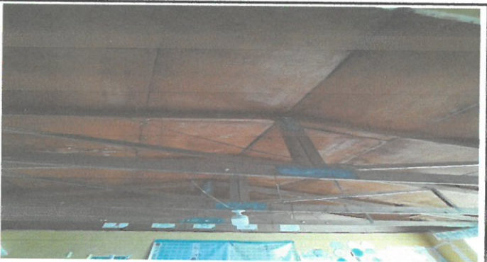
Foto 1.4: Sustrucción de estructura de madera por estructura de metal con vigas de perfil tubular rectangular, en dos aulas frente al patio del centro educativo.