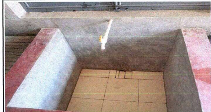
Foto 10: Suministro de Pila de 2 Lavaderos revistida de Azulejo (Incluye drenaje sanitario)