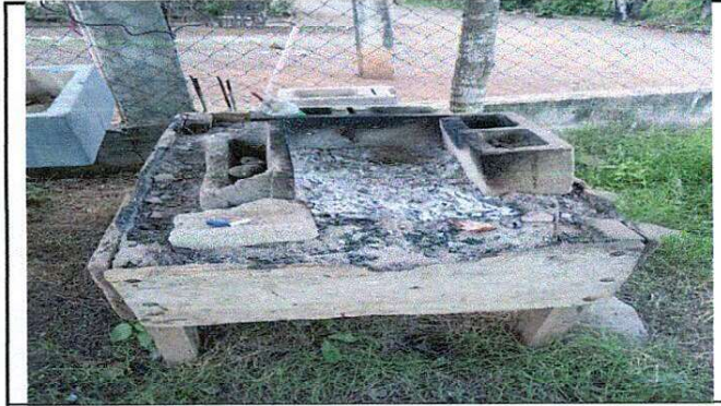
Foto 2: Suministro de estufa Rural (completa), incluye chimenea y plancha de Metal de 3 hornias.