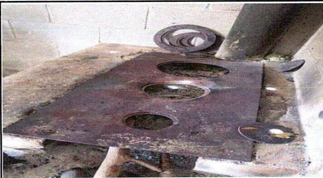
Foto 3: Sustitucion de Plancha de Metal de 3 hornias, incluye Chimenea.