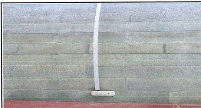
Foto 5: Sustitucion del Sistema Electrico (Incluye cable, 4 focos, 4 plafoneras).