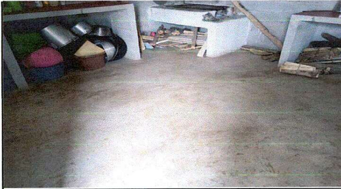
Foto 1: Sustitucion de piso de torta de concreto por piso de granito