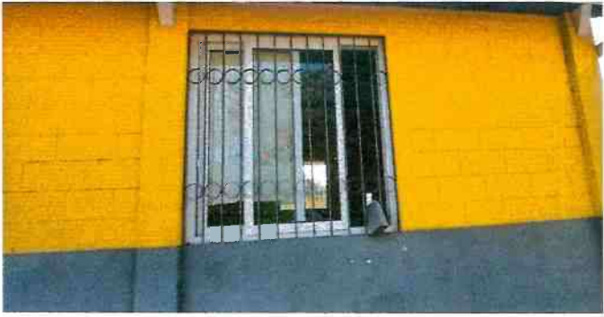
Pintura en muros interiores y exteriores.