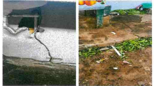
Mano de obra con factura / suministro de tubería de línea principal.

Observación: Si es necesario se pueden agregar hojas adicionales y actualizar el número de hojas.