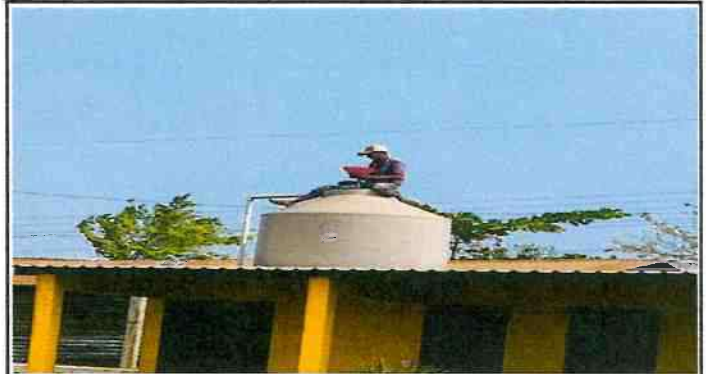
Reparación y mantenimiento de cisterna / depósito de agua.