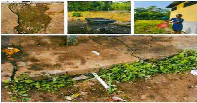
Reparación de red de drenaje y red de agua potable