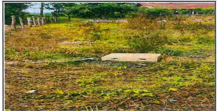
Limpieza de fosa séptica.

Observación: Si es necesario se pueden agregar hojas adicionales y actualizar el número de hojas.