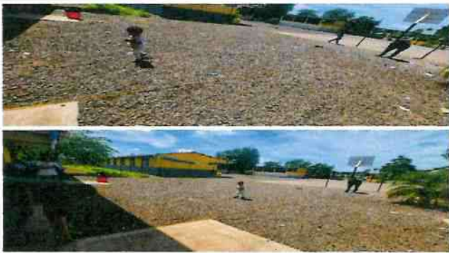
Losa de patio / sustitución de losa de patio de concreto.