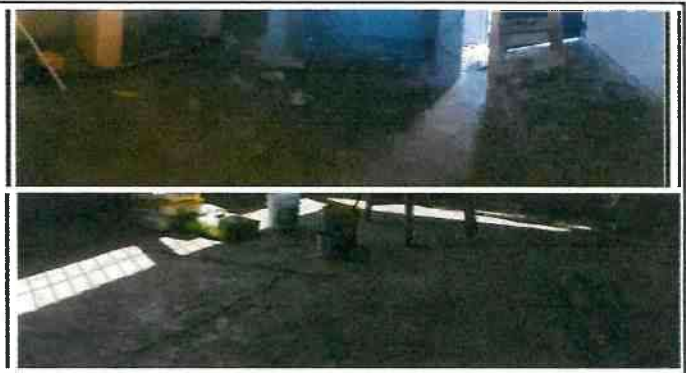
Piso / sustitución de torta de concreto por piso cerámico en cocina y aula.