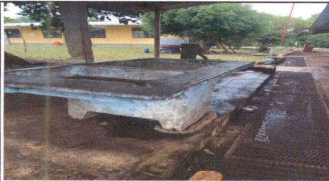
Foto 3: Suministro de llave de chorro para cocina y servicios sanitarios, suministro de tubería de línea principal de agua potable