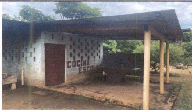
Foto1: Reparación de Cocina, cambio de pila, suministro de gabinetes de concreto revestido de azulejo, sustitución de lámina por lámina troquelada, sustitución de estructura de madera por estructura de metal, suministro de mesa de concreto revestida de azulejo, sustitución de torta de concreto por piso cerámico, sustitución del sistema eléctrico, sustitución de tubería principal de agua negras