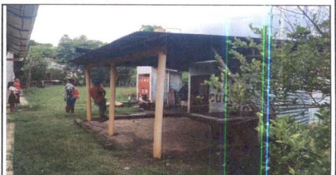
Foto 6: Suministro de ventana de PVC para la cocina, suministro de balcones de metal para ventanas de cocina

Observación: Si es necesario se pueden agregar hojas adicionales y actualizar el número de hojas.