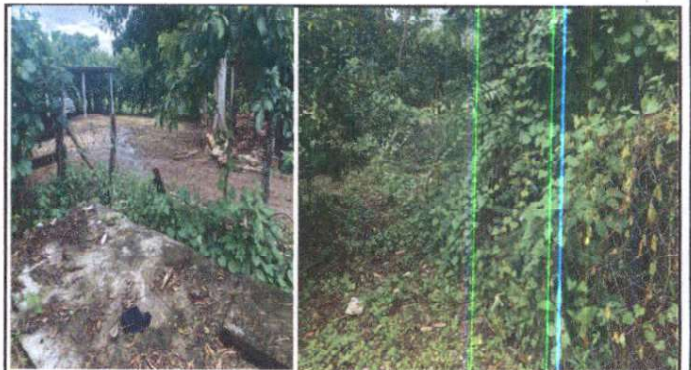
Foto 4: Sustitución de malla galvanizada por malla galvanizada y tubo de 2 pulgadas