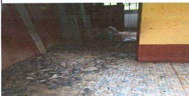
Foto1: Mantenimiento a estructura de puerta de metal, por metal.