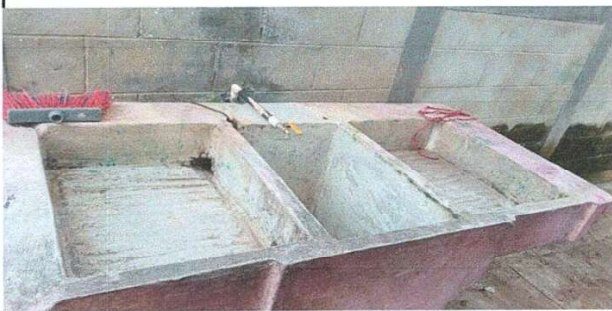
Foto1: Mantenimiento de pila de concreto de dos lavaderos.