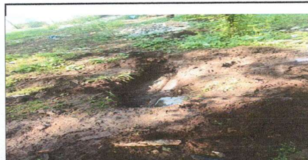
Foto 6: Mantenimiento de caja de registro y sustitución de tubería PVC de agua pluviales.

Observación: Si es necesario se pueden agregar hojas adicionales y actualizar el número de hojas.