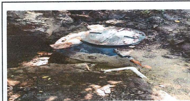
Foto 5: Sustitución de tubería PVC lineal principal de aguas negras