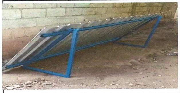
Foto 6: Sustitución de estructura de soporte de madera, por metal.

Observación: Si es necesario se pueden agregar hojas adicionales y actualizar el número de hojas.