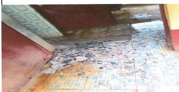
Foto 3: Sustitución de piso de granito, por piso cerámico antideslizante.