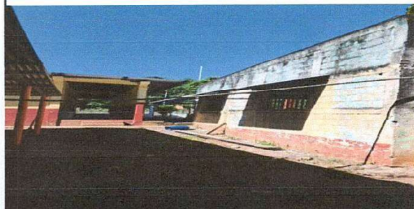
Foto 2: Sustitución de cubierta de lámina, por lámina troquelada aluzinc calibre 26