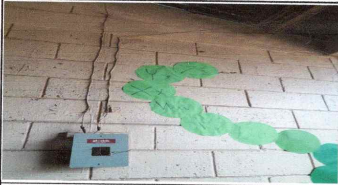
FOTO 1: Sustitución del sistema eléctrico en el establecimiento educativo