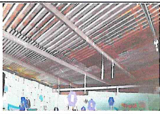
Foto 6: Sustitución de lámina, por lámina troquelada aluzinc calibre 26

Observación: Si es necesario se pueden agregar hojas adicionales y actualizar el número de hojas.