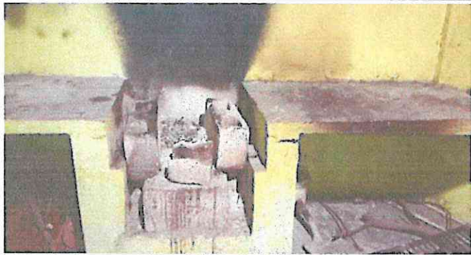
Foto1: Mantenimiento estufa Rural