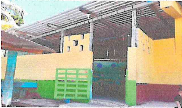
Foto1: Sustitución de lámina, por lámina troquelada aluzinc calibre 26