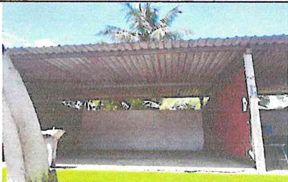
Foto 5: Sustitución de lámina, por lámina troquelada aluzinc calibre 26