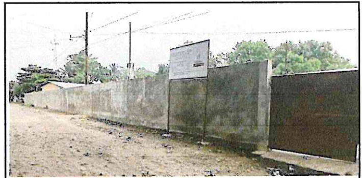
PINTURA DE PARED EXTERIOR

Observación: Si es necesario se pueden agregar fotografías adicionales y actualizar el número de hojas.