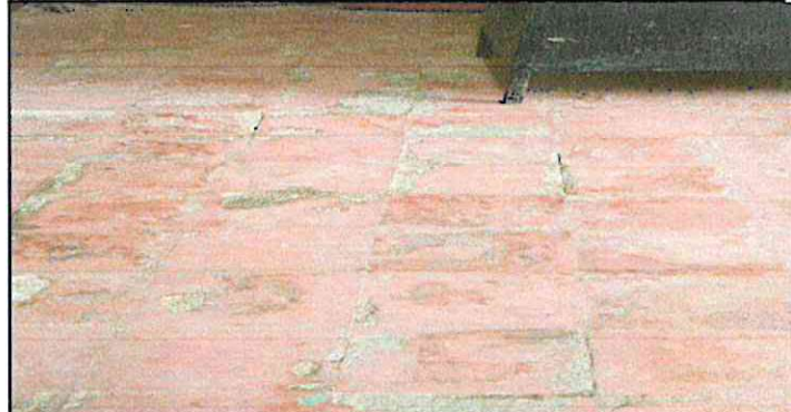
CAMBIO DE PISO EN DIRECCION