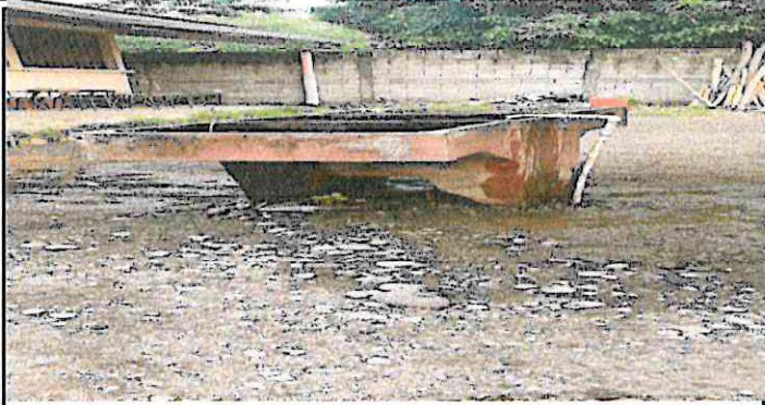
CAMBIO DE PILAS Y REALIZAR PLANCHA