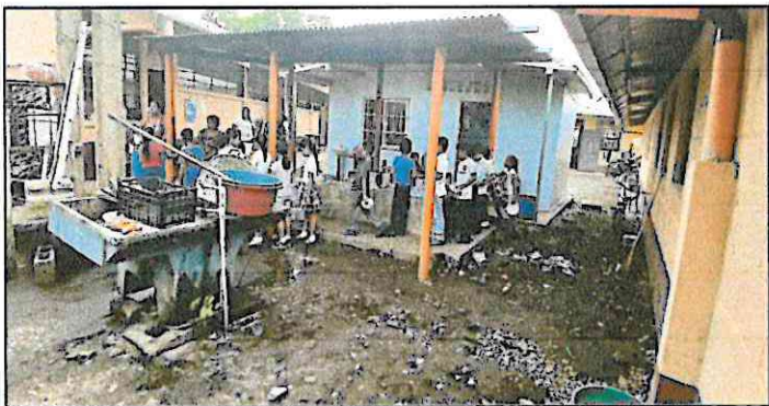
REMDELACION DE COCINA Y MEJORAMIENTO EN PISO DE COCINA.