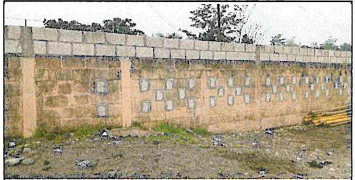
REPELLO DE PARED INTERNA