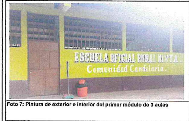
Foto 7: Pintura de exterior e interior del primer módulo de 3 aulas