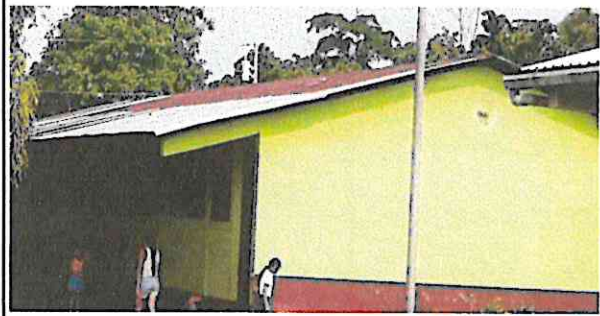
Foto 1: Sustitución de cubierta de lámina por lámina troquelada calibre 26, sustitución de 3 puertas de metal con chapa.