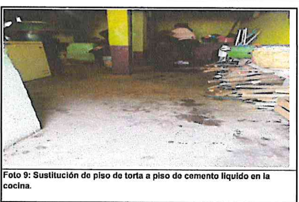
Foto 9: Sustitución de piso de torta a piso de cemento liquido en la cocina.