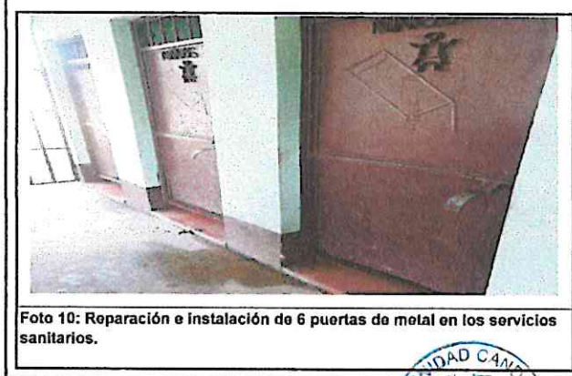
Foto 10: Reparación e instalación de 6 puertas de metal en los servicios sanitarios.