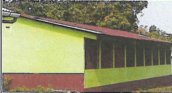
Foto 2: Sustitución de estructura de metal parte trasera del primer modulo 3 aulas y mantenimiento de estructura de soporte de metal .