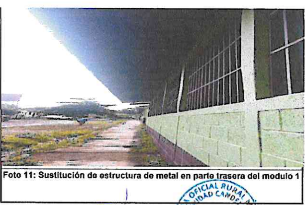
Foto 11: Sustitución de estructura de metal en parte trasera del modulo 1

Observación: Si es necesario se pueden agregar hojas adicionales y actualizar el número de hojas.