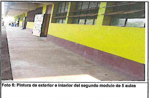
Foto 8: Pintura de exterior e interior del segundo modulo de 5 aulas