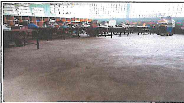
Foto 4: Sustitución de piso de cemento liso a piso de cerámico para exterior de 3 aulas.