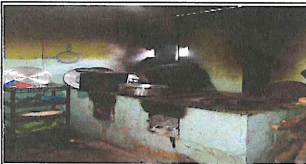
Foto 5: Sustitución de estufa rural de 2 ornilas y mantenimiento de chimenea.