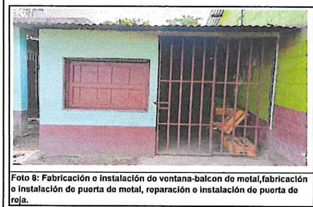
Foto 8: Fabricación e instalación de ventana-balcon de metal, fabricación e instalación de puerta de metal, reparación e instalación de puerta de roja.