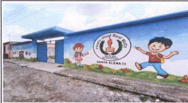
Foto 3: pintura en pared de entrada, visera de cemento y porton de entrada principal 1