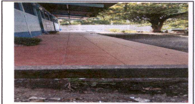
Foto 4: sustitución de torta de cemento por piso ceramico en corredor