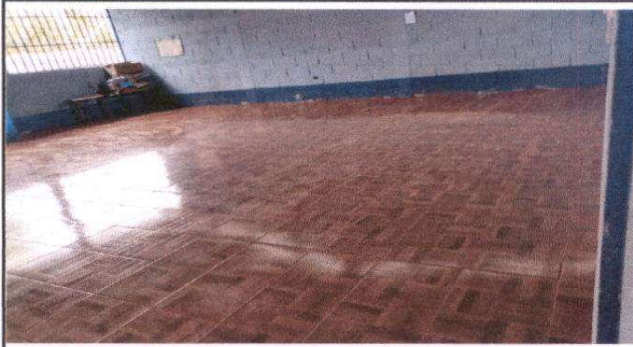
Foto1: sustitución de torta de cemento por piso ceramico