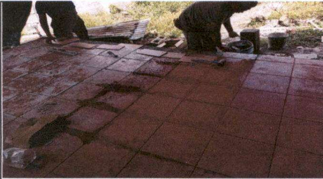
Foto1: Sustitución de piso de torta de cemento por piso ceramico corredor