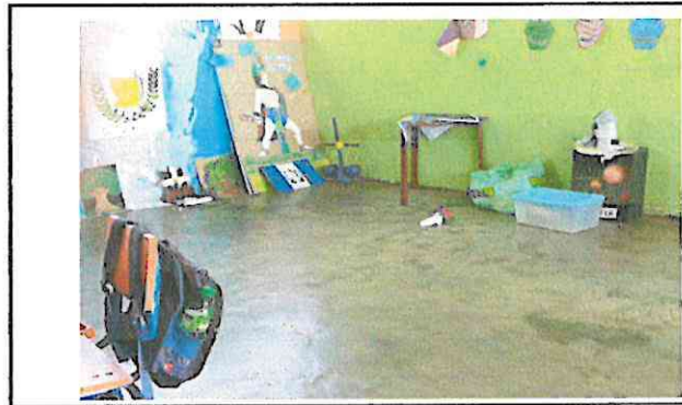
Foto 6: Sustitución de piso de torta de concreto por piso cerámico

Observación: Si es necesario se pueden agregar hojas adicionales y actualizar el número de hojas.