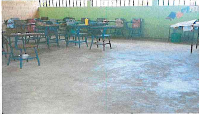
Foto1: Sustitución de piso de torta de concreto por piso cerámico