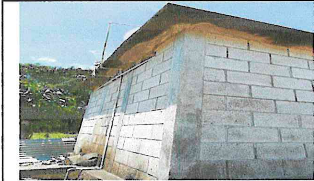
Foto1: Pintura en muros exteriores e interiores de baños