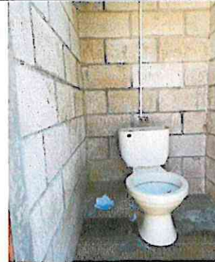
Foto 4: Sustitución de piso de torta de concreto por piso cerámico en baños