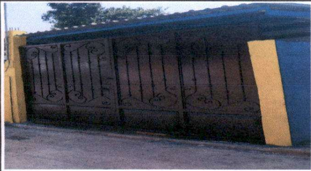
reparación de porton de ingreso.