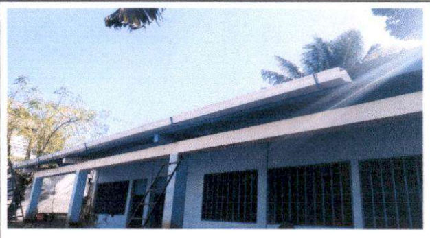
reparación de canales