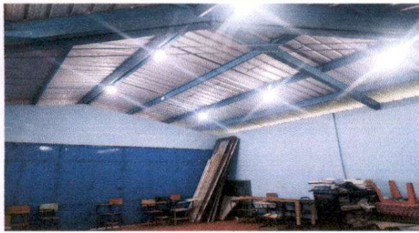
reparación del sistema eléctrico