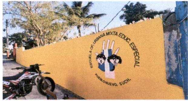
reparación de muro perimetral.