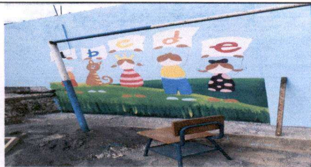
pintura de muros interiores y exteriores.