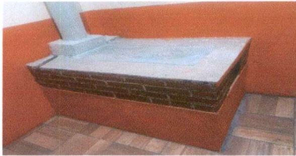
Reparación de estufa rural