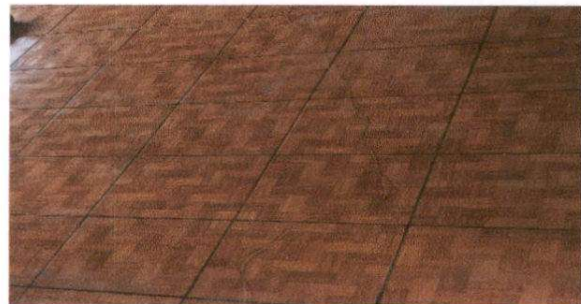
Sustitución de piso de granito por cerámico en aula

Observación: Si es necesario se pueden agregar hojas adicionales y actualizar el número de hojas.