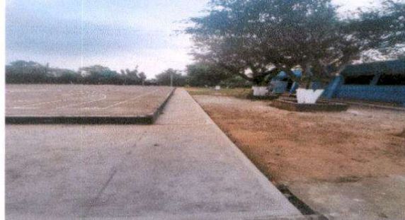
Sustitución de una banqueta de concreto

Observación: Si es necesario se pueden agregar hojas adicionales y actualizar el número de hojas.