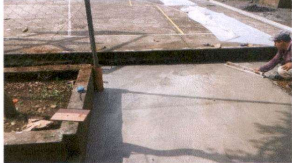
Sustitución de una banqueta de concreto