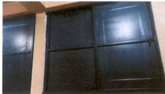
Suministro de ventana-balcón de metal por metal