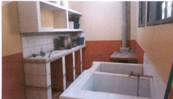
Mantenimiento y reparación de muebles de cocina 2. Estufa rural 1.31 de largo por 85 de ancho