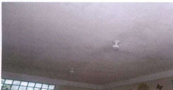
Sustitución de plafoneras más foco