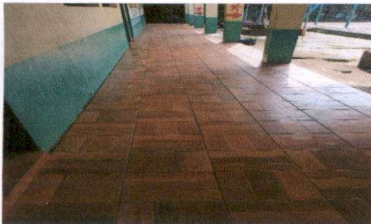
Sustitución de piso de granito por cerámico en corredor