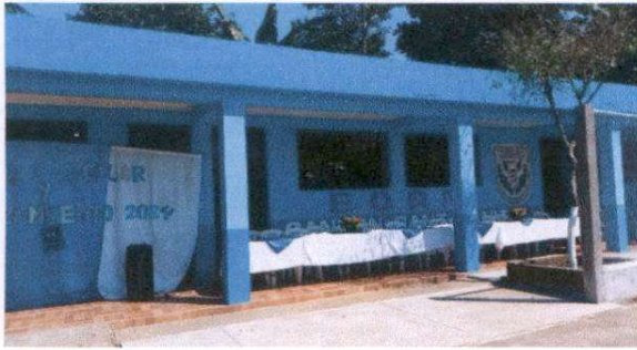
Mantenimiento de pintura para el área exterior de la Escuela