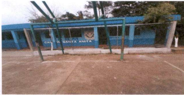
Sustitución de muro perimetral de block con tubo hg y malla galvanizada, soleras intermedias y columnas.