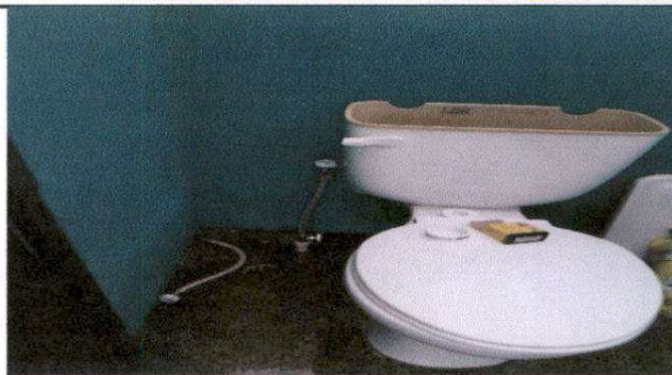
Sustitución de accesorios en inodoro (contra llave, manguera de abasto)