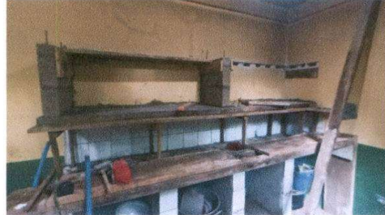
Reparación de gabinete de cocina y suministro