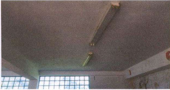
Sustitución de lámparas tipo led