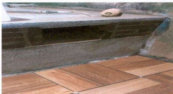
Mantenimiento y reparación de estufa rural

Observación: Si es necesario se pueden agregar hojas adicionales y actualizar el número de hojas.