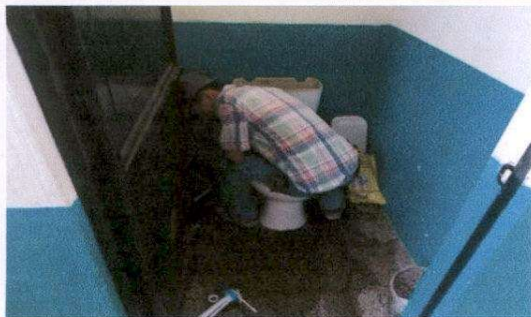
Sustitución de accesorios en inodoro (contra llave, manguera de abasto)