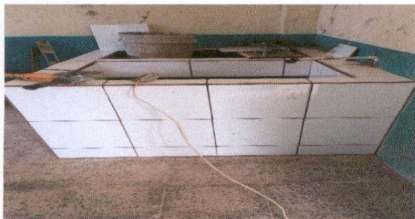
Suministro de pila de un lavadero