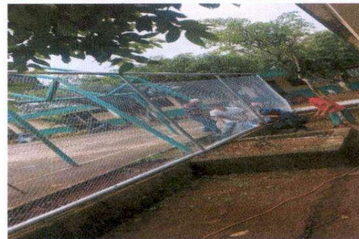
Sustitución de muro perimetral de block con tubo hg y malla galvanizada, soleras intermedias y columnas.

Observación: Si es necesario se pueden agregar hojas adicionales y actualizar el número de hojas.