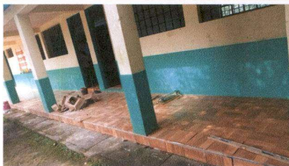
Sustitución de piso de granito por cerámico en pasillo