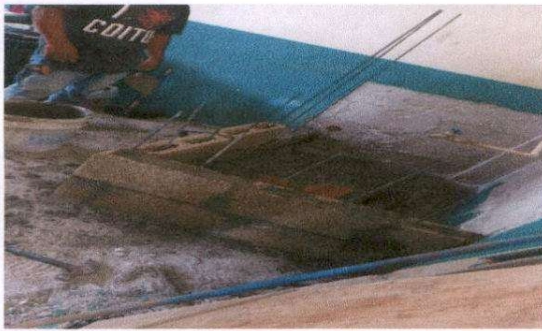
Suministro de pila