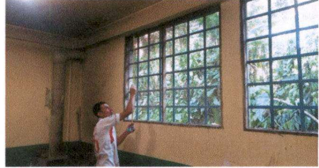
Suministro de ventana-balcón de metal por metal