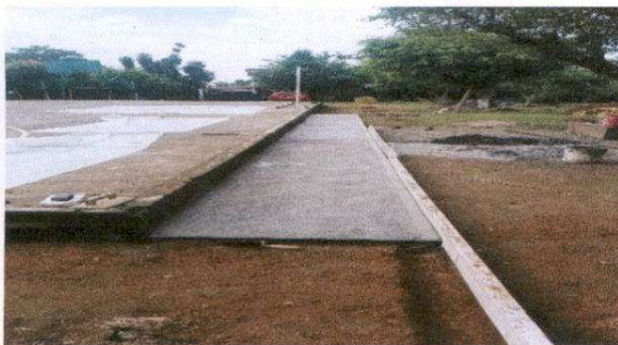
Sustitución de una banqueta de concreto