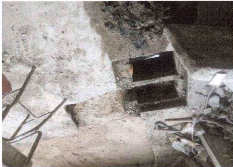
Foto 3: Reparación de red de drenaje (sustitución de rejilla de aguas pluviales)