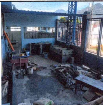
Foto 5: Cubierta de lámina, sustitución de estructura de madera por metal, sustitución de pintura, sustitución de balcones de metal por ventanas PVC, sustitución de pila por pila rural.