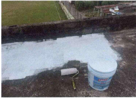
Foto1: Impermeabilización de losa