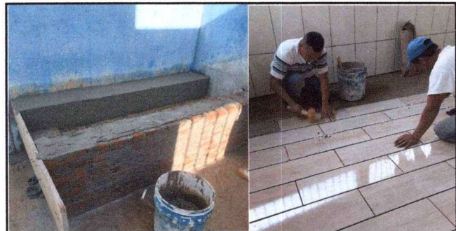
Foto 6: Sustitución de estufa rural (completa) incluye chimenea y plancha de metal y sustitución de piso de concreto por cerámico.

Observación: Si es necesario se pueden agregar hojas adicionales y actualizar el número de hojas.