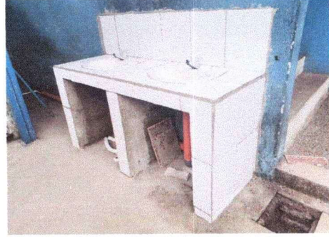
Construcción de 2 lavamanos, Módulo Sur