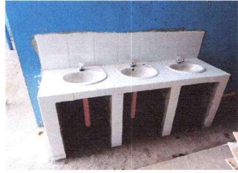
Construcción de 3 lavamanos, módulo Norte