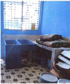
Cambio de lavatrastos por pila de 1 lavadero en cocina escolar, módulo Norte