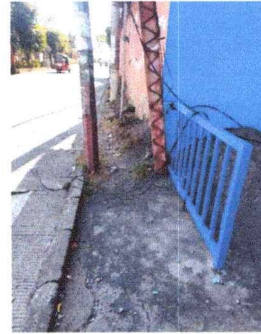
Cambio de tope de ingreso en portón Principal, módulo norte