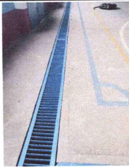
Mantenimiento de rejilla de cancha escolar, módulo sur