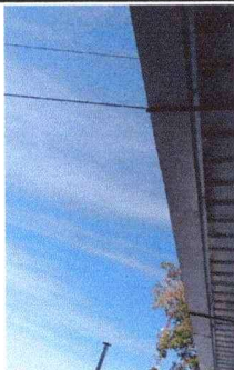
Instalación de canales para bajada de agua pluvia, módulo sur