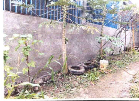
Repello de pared exterior

Observación: Si es necesario se pueden agregar hojas adicionales y actualizar el número de hojas.