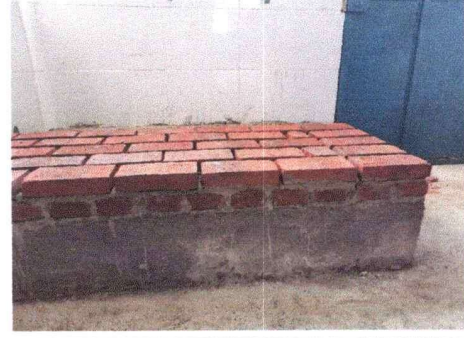
Construcción de cocina rural con hornillas, cocina escolar, módulo sur