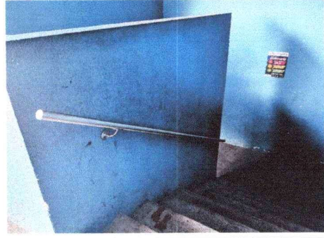
Pasamanos en graderío, Módulo sur