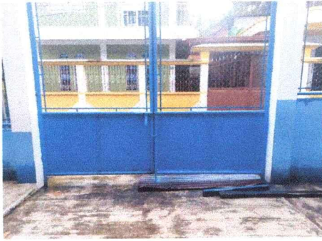
Mantenimiento de Portón principal, lijado y pintura, Módulo sur