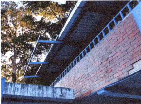
Ampliación de techo sobre sanitarios, Módulo Norte