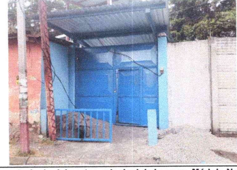
Estructura y techado del porton principal de ingreso, Módulo Norte

Observación: Si es necesario se pueden agregar hojas adicionales y actualizar el número de hojas.