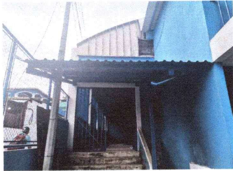
Techado de ingreso a Cancha escolar