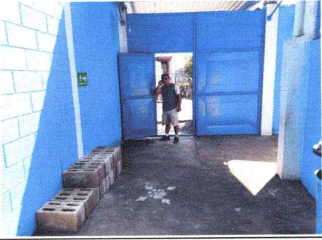
Mantenimiento de porton de ingreso, lijado y pintura, módulo Norte