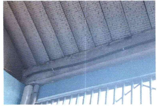
Cambio de cableado de energía eléctrica en cancha escolar, instalación de 2 lámparas Led, Módulo sur