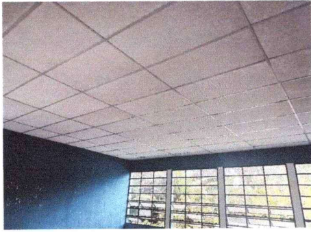
Cielo falso de aulas, módulo sur