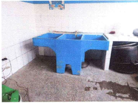
Instalación de pila de concreto de 2 lavaderos en cocina escolar, módulo sur