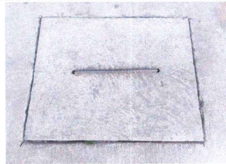
Tapaderas para cajas de registro de sistemas de agua

Observación: Si es necesario se pueden agregar hojas adicionales y actualizar el número de hojas.