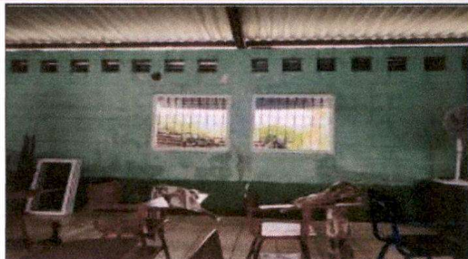
Foto 2 : Sustitucion de piso de concreto por piso de ceramico y sustitucion de ventanas a ventanas de pvc coredizas.