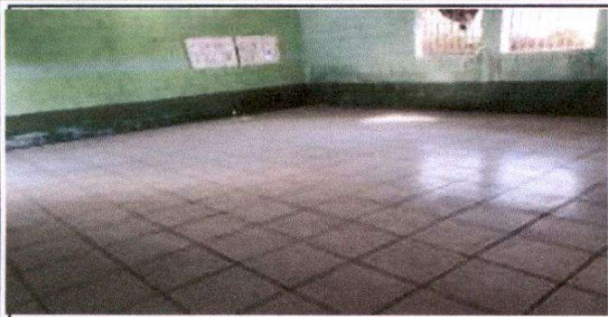
Foto1: Foto1: Sustitucion de piso de concreto por piso de ceramico