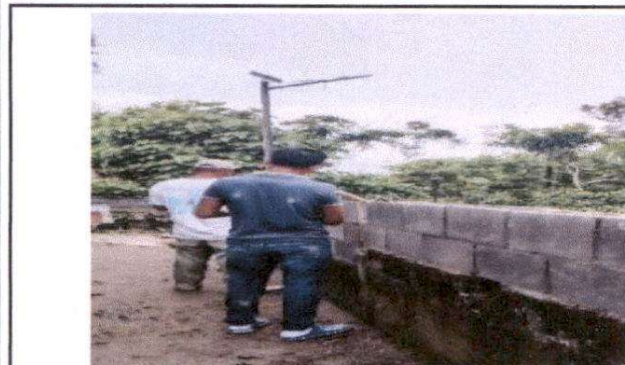
FOTO 3: Suministro de block de 0.14*0.39 para nivelación de muros, suministro de malla galvanizada, más tubo de 1/2