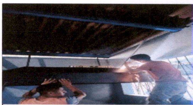
Foto 6: Suministro de ladrillo para estufa rural, suministro de plancha de metal de 1.20x0.60x de espesor de 1/2

Observación: Si es necesario se pueden agregar hojas adicionales y actualizar el número de hojas.