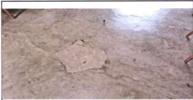
Foto1: Foto1: Sustitucion de piso de concreto por piso de ceramico