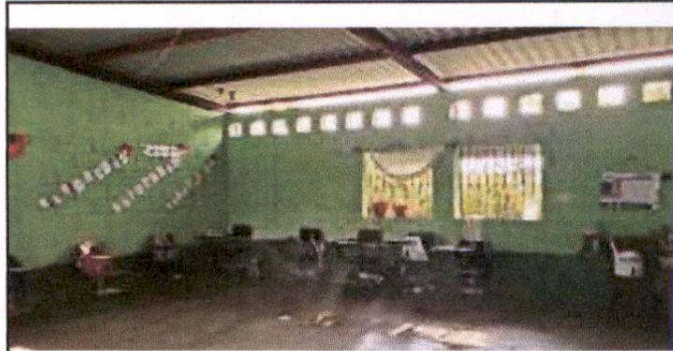
Foto 2: Sustitucion de cableado electrico y accesorios, sustitucion de ventanas a ventanas de pvc coredizas.