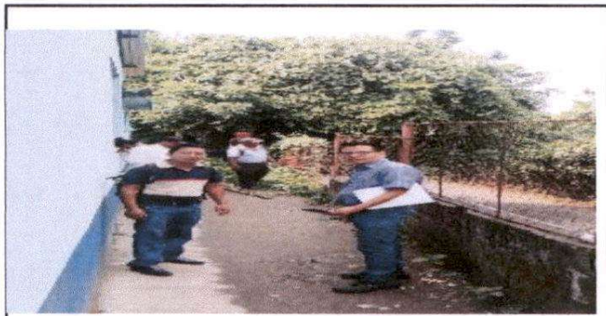
FOTO 3: Suministro de block de 0.14*0.39 para nivelación de muros, suministro de malla galvanizada, más tubo de 1/2