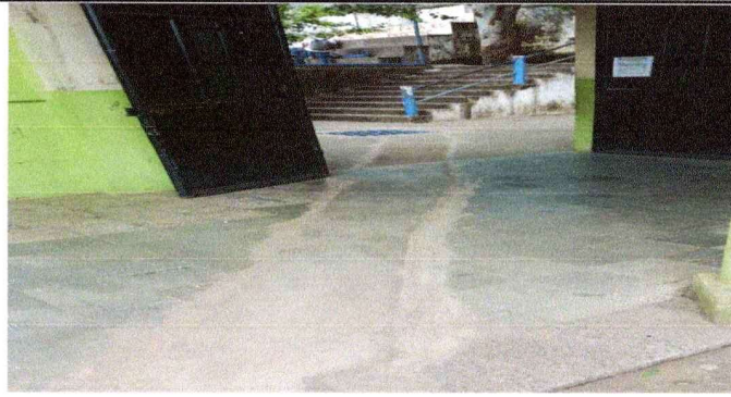
Foto 1: Reposadera de agua, rejilla, torta de concreto y piso de granito que fue sustituido.