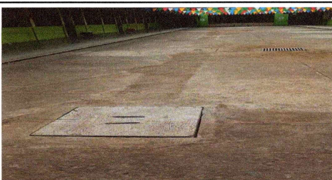
Foto 5: Caja de registro y paso de tubería de drenaje y de agua potable que fue sustituida.