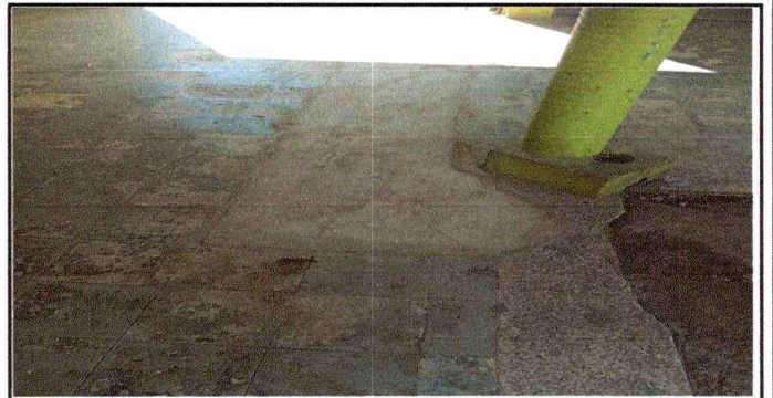
Foto 6: Piso de granito que debe ser sustituido por torta de concreto.

Observación: Si es necesario se pueden agregar hojas adicionales y actualizar el número de hojas.