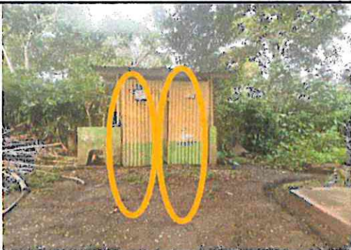
Foto 5: Sustrucción de puertas de láminas por metal de los servicios sanitarios.