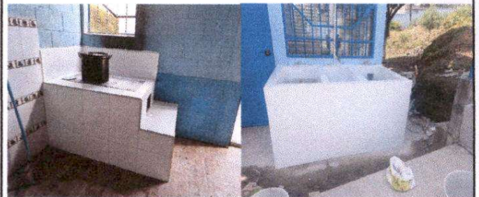
Foto 6: Sustitución de estufa rural, pila y levantado de mampostería de block en cocina.

Observación: Si es necesario se pueden agregar hojas adicionales y actualizar el número de hojas.