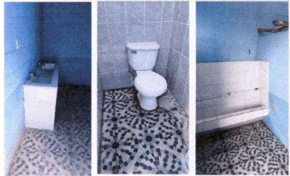
Foto 4: Sustitución de lavamanos por lavamanos de concreto, cambio de accesorios de inodoros y sustitución de llaves de paso para mijitorios.