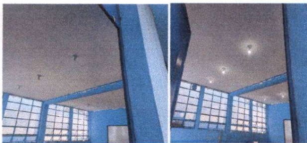
Foto 5: Cernido en techo de módulo de aulas y reparación de sistema eléctrico.