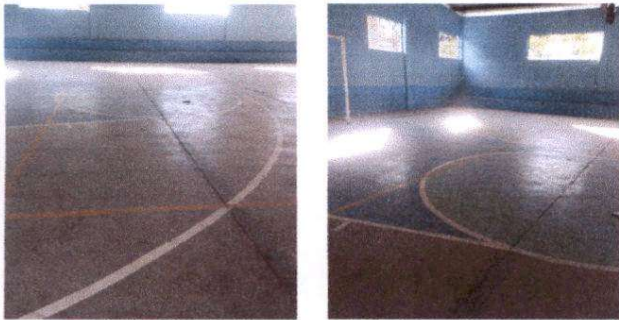
Foto 3: Aplicación de pintura en cancha polideportiva y reparación de plancha de concreto de patio.