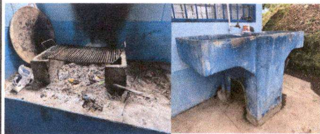
Foto 6: Sustitución de estufa rural, pila y levantado de mampostería de block en cocina.

Observación: Si es necesario se pueden agregar hojas adicionales y actualizar el número de hojas.