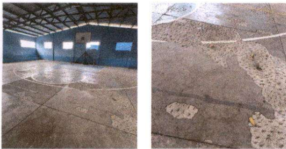
Foto 3: Aplicación de pintura en cancha polideportiva y sustitución de plancha de concreto de patio.