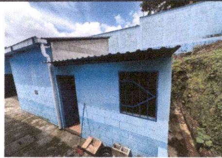
Foto 2: Sustitución de ventanas de metal por ventanas de PVC y fabricación de balcones de metal.