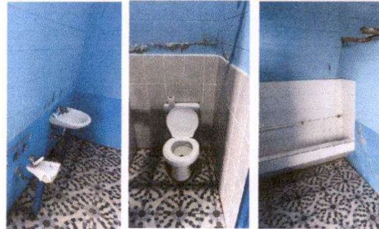
Foto 4: Sustitución de lavamanos por lavamanos de concreto, cambio de accesorios de inodoros y sustitución de llaves de paso para mijitorios.