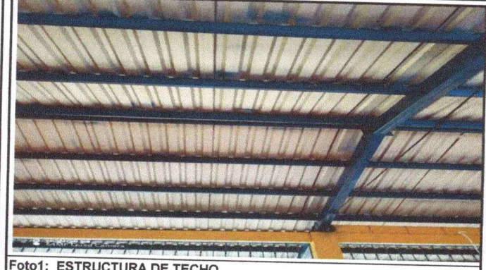
Foto1: ESTRUCTURA DE TECHO