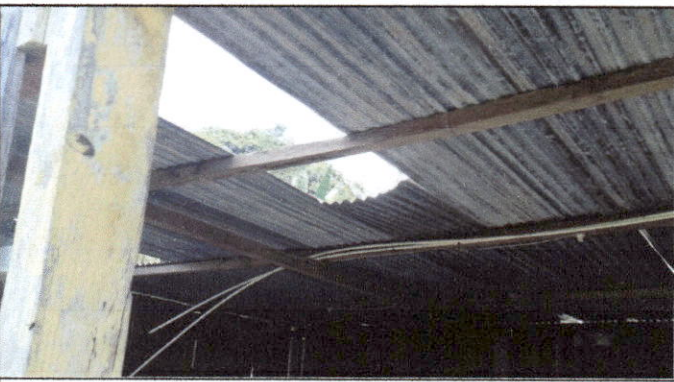
Foto 5: Debido al mal estado en el que se encuentra, se solicita la reparación urgente de la cubierta de lámina en módulo de aulas.