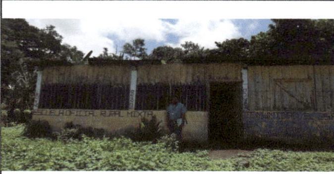
Foto 1: Vista panorámica del evaluador frente al rótulo de identificación de la escuela en cuestión.