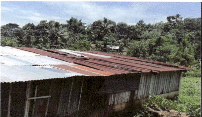
Foto 4: Solicitan trabajos de remozamiento en módulo de aulas. Entre los trabajos solicitados está el cambio y reparación de la cubierta de lámina.