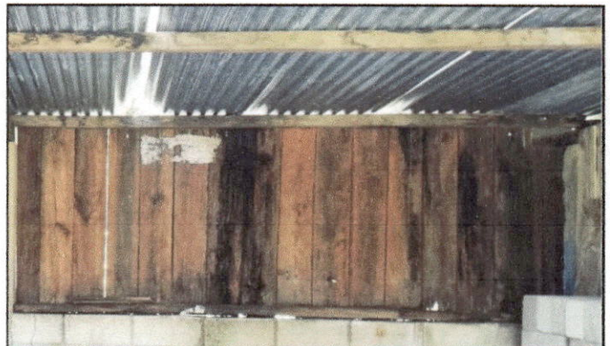
Foto 10: Por temas de seguridad e iluminación, solicitan el mejoramiento de ventanas en módulo de aulas.