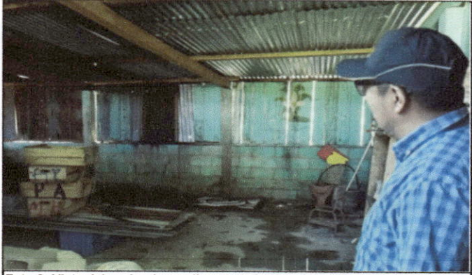
Foto 2: Vista del evaluador realizando la inspección del estado en el que se encuentra un módulo de aulas.