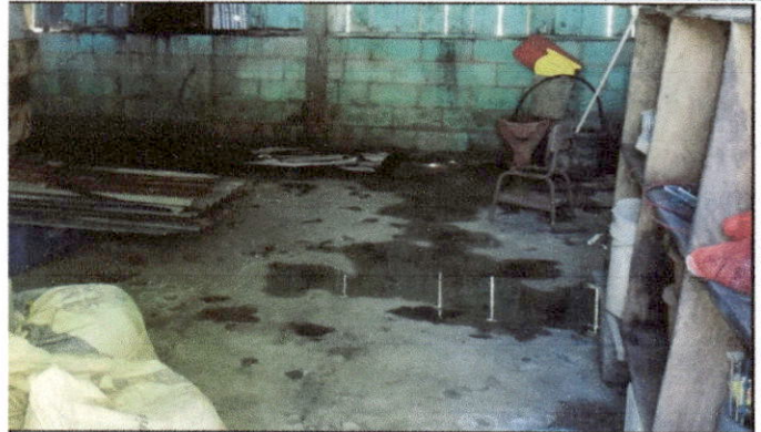
Foto 8: Se solicitan trabajos de mejoramiento en aulas. Entre las mejoras solicitadas está la colocación de piso cerámico antideslizante.