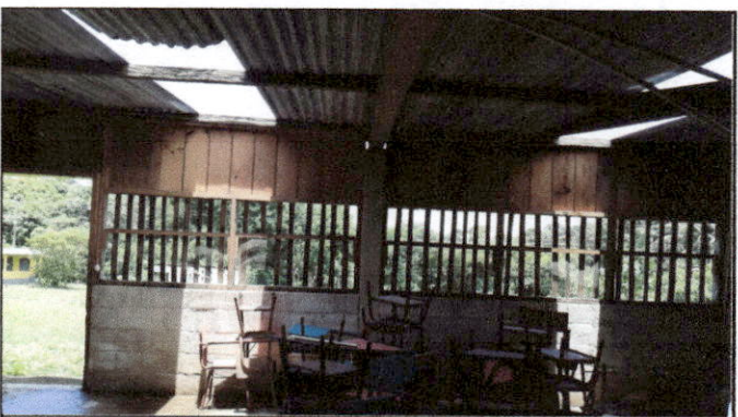
Foto 6: Debido al mal estado en el que se encuentra, se solicita la reparación urgente de la cubierta de lámina en módulo de aulas.