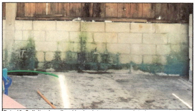
Foto 12: Solicitan la aplicación de pintura en muros interiores y exteriores de módulos de aulas.