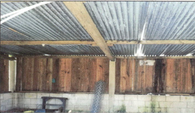
Foto 3: Solicitan trabajos de remozamiento en módulo de aulas. Entre los trabajos solicitados está el cambio y reparación de la cubierta de lámina.