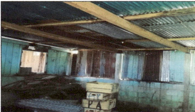
Foto 9: Por temas de seguridad e iluminación, solicitan el mejoramiento de ventanas en módulo de aulas.