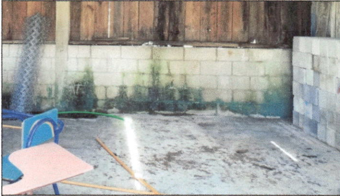
Foto 7: Se solicitan trabajos de mejoramiento en aulas. Entre las mejoras solicitadas está la colocación de piso cerámico antideslizante.