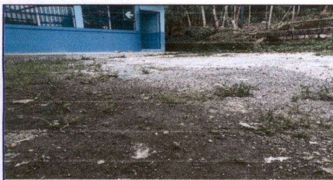
Foto 5: Sustitución de torta de concreto por torta de concreto de 10 centímetros de espesor