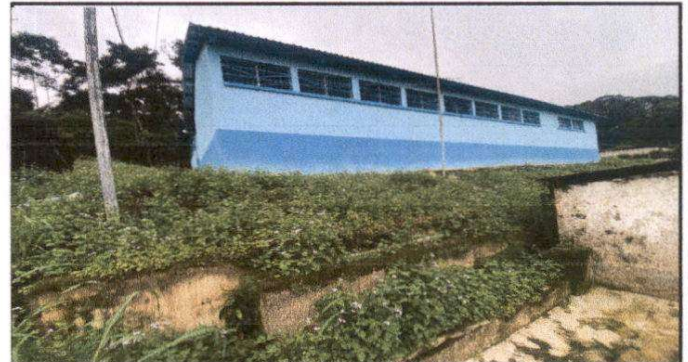
Foto 4: Sustitución de bajadas de agua pluvial (incluye accesorios)