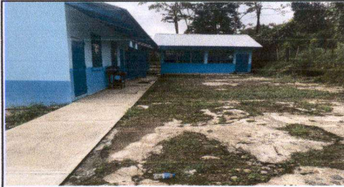
Foto 1: Sustitución de lámina, por lámina troquelada aluzinc calibre 26