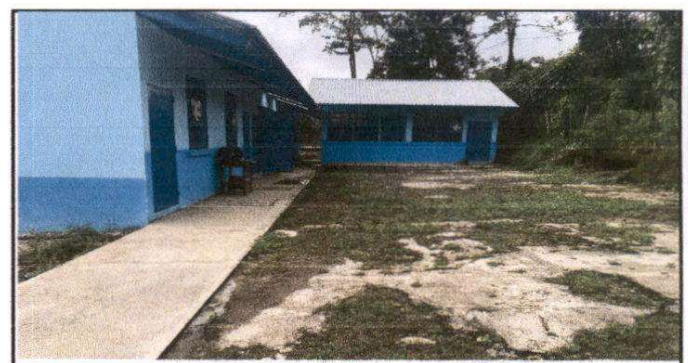
Foto 6: Sustitución de torta de concreto por torta de concreto de 10 centímetros de espesor

Observación: Si es necesario se pueden agregar hojas adicionales y actualizar el número de hojas.