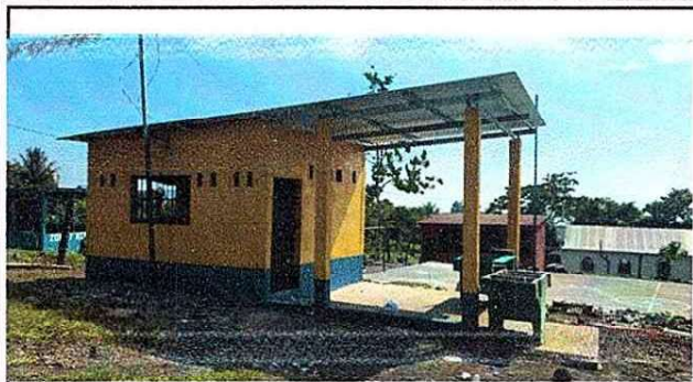
Foto1: Reparación de cocina