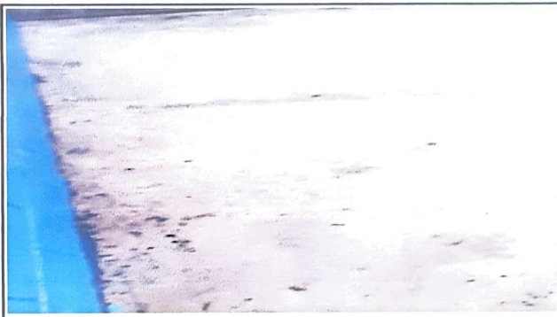
Foto2: SUSTITUCION DE TORTA DE CEMENTO POR PISO CERAMICO