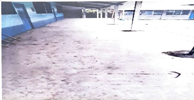
Foto1: SUSTITUCION DE TORTA DE CEMENTO POR PISO CERAMICO