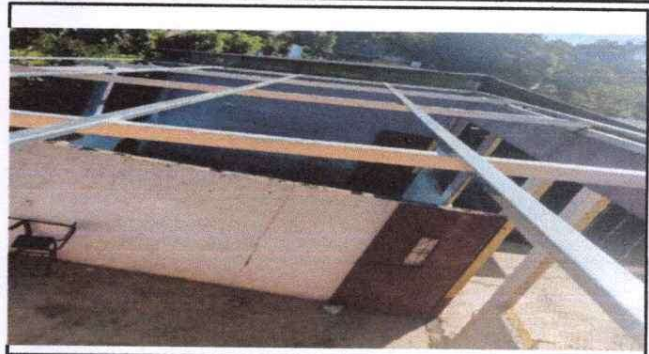
Foto 2: Avance de colocación de estructura metálica en las aulas y corredor.