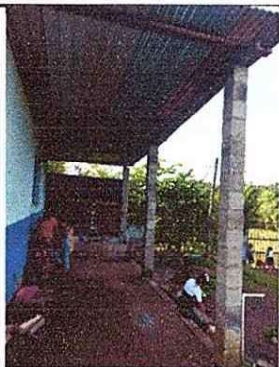
Foto1: Exterior de cocina