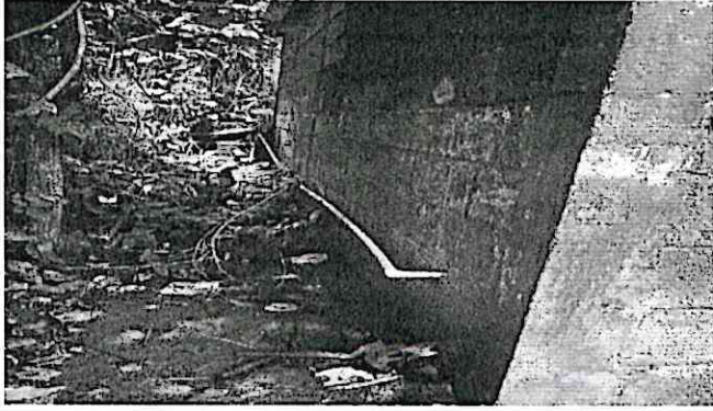
Reparación de tubería de sistema de agua potable