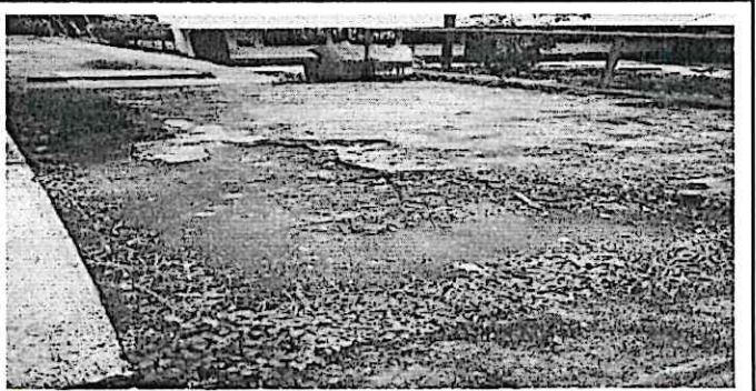
Torta de concreto

Observación: Si es necesario se pueden agregar hojas adicionales y actualizar el número de hojas.