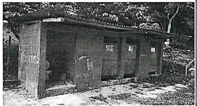
Sustitución de estructura de soporte de madera por metal y cambio de cubierta de lámina.