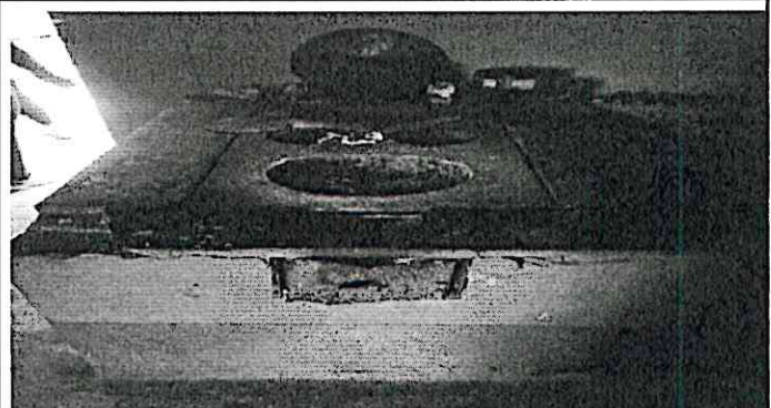
Sustitución de plancha de polletón