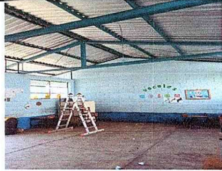
Foto 4 Instalacion de energia electrica