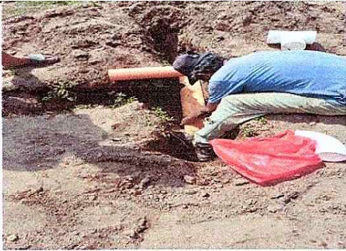
Foto1: Instalacion de tuberia para drenaje