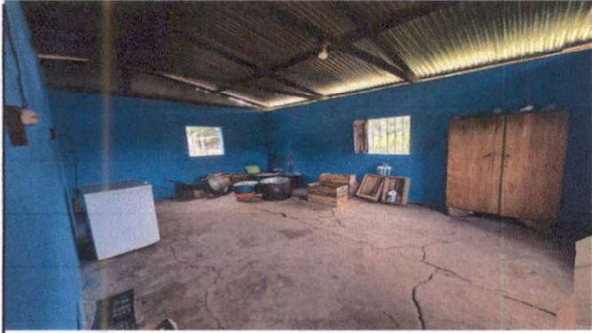
Foto1: Sustitución de piso de torta por piso de cerámica.