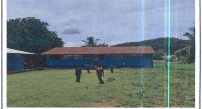
Foto 4: Sustitución de lámina por lámina troquelada aluzinc calibre 26