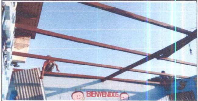
Foto 2: Cubierta de laminas, sustitución de láminas por lamina troquelada Aluzinc calibre 26.