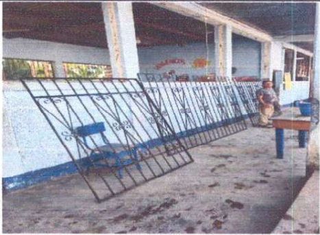
Foto1: Sustitución de malla por balcones en ventanas de aulas