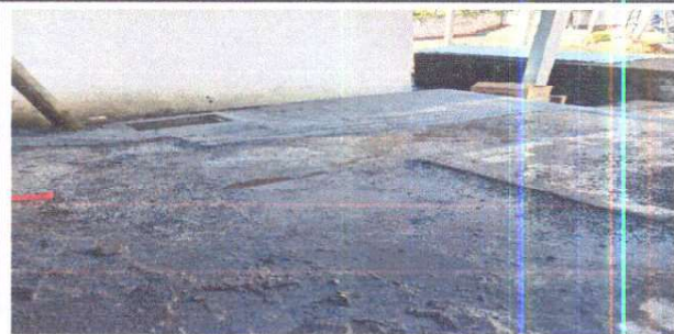
Foto 6: sustitución de tubería pvc línea pincipal de agua potable

Observación: Si es necesario se pueden agregar hojas adicionales y actualizar el número de hojas.