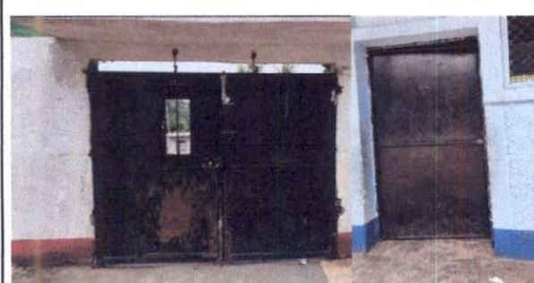
Foto 5: Sustitución de Portón de metal entrada principal y sustitución de puertas de 2 aulas