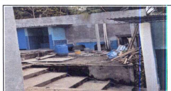
Foto 6: sustitución de tubería pvc línea principal de agua potable

Observación: Si es necesario se pueden agregar hojas adicionales y actualizar el número de hojas.