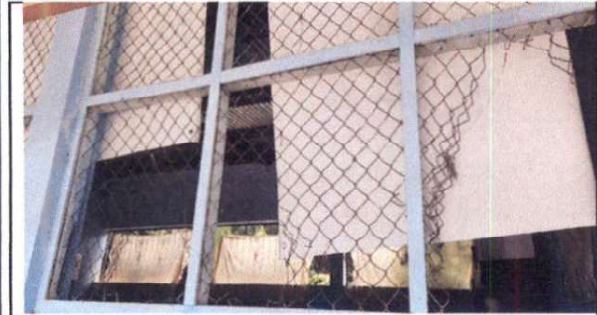
Foto 1: Sustitución de malla por balcones de metal en ventanas de aulas