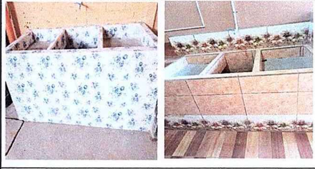
Foto 6: En el modulo de cocina se sustituirá el piso ceramico, tambien se realizara un pila grande con su azulejo y se cambiara el sistema electrico de la cocina.

Observación: Si es necesario se pueden agregar hojas adicionales y actualizar el número de hojas.