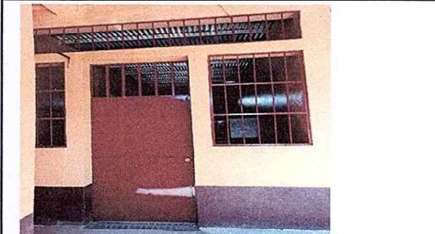
Foto 4: En el modulo de Cocina se trabajara sustitución de puerta de metal, ampliación de ventana con balcon , nivelación de pared para una sola caída, cambio de costanera de metal y de lamina troquelada de 29 pies.