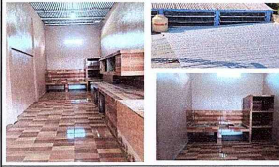
Foto 5: En esta parte se trabajara la demolición total y se trasladara para el fondo de la cocina, realizando un nuevo polleton para cocina con chimenea con tres discos. Y techado de cocina