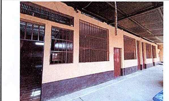
Foto 3: En esta parte se realizara una avertura y tallado de puerta de metal, y tallado de ventana con balcon.