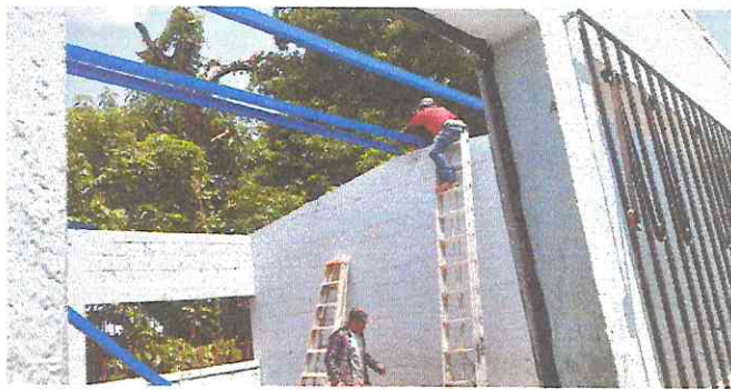
Foto 3: DURANTE EL PROCESO DEL NUEVO TECHADO DE LA ESCUELA QUE SE LOGRÓ CON EL QUINTO PROGRAMA, REMOZAMIENTO.