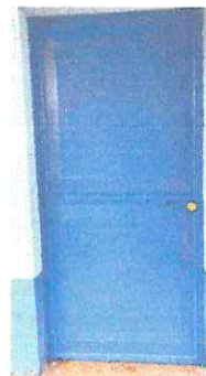
Foto 6: NUEVA ESTRUCTURA EN LAS PUERTAS DE LOS SALONES DE CLASES DE LA ESCUELA.

Observación: Si es necesario se pueden agregar hojas adicionales y actualizar el número de hojas.