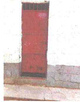
Foto 2: EN LA FOTOGRAFIA SE PUEDE EVIDENCIAR LAS CONDICIONES DE LAS PUERTAS.