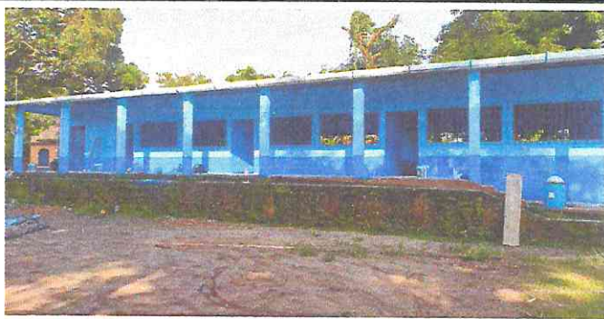
Foto 5: PRESENTACIÓN DE LA ESCUELA EN LA CULMINACIÓN DEL PROYECTO DE REMOZAMIENTO.