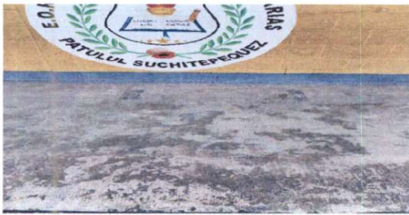
Foto 1: reparación de banqueta de concreto, derivado al deterioro de la actual.