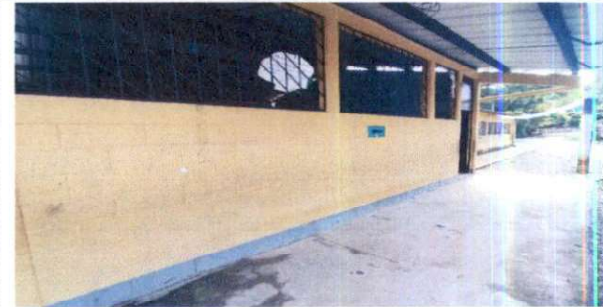
Foto 6: Reparación de losa de patio, por agrietamiento en el mismo.

Observación: Si es necesario se pueden agregar hojas adicionales y actualizar el número de hojas.