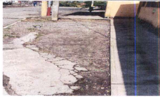
Foto 2: reparación de planchas de concreto, derivado a grietas que presentan.