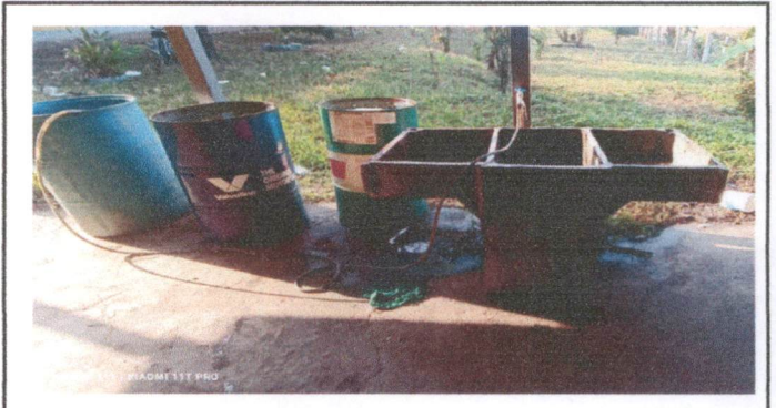
Sustitución de pila