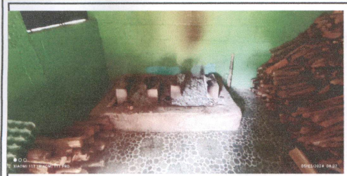
Sustitución de estufa rural (completa incluye chimenea y plancha de metal)