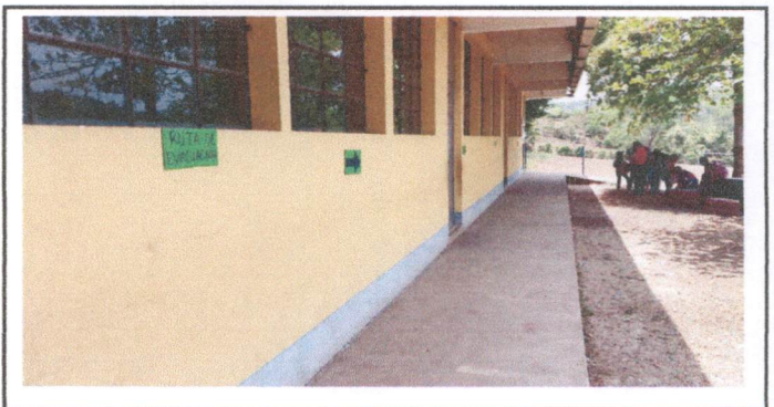
Losa de patio frente a módulo de aulas

Observación: Si es necesario se pueden agregar hojas adicionales y actualizar el número de hojas.