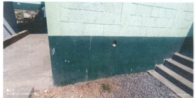
Suministro e instalación de mueble fijo de concreto armado revestido con azulejo

Observación: Si es necesario se pueden agregar hojas adicionales y actualizar el número de hojas.