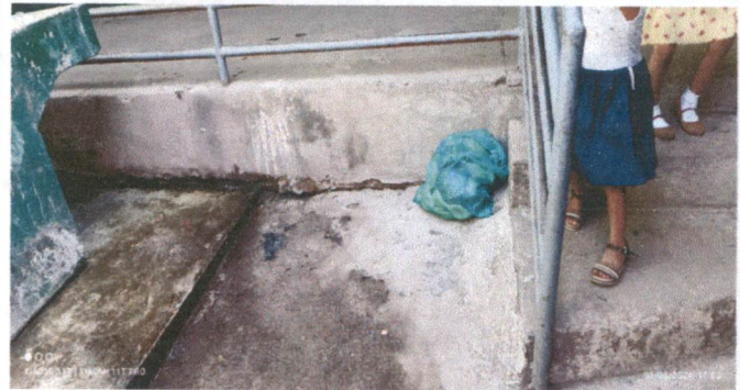
Fundición de gradas para acceso a cocina