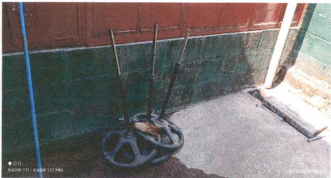
Suministro e instalación de pila de dos lavaderos