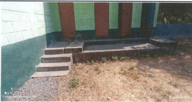
Fundición de gradas para acceso a servicios sanitarios