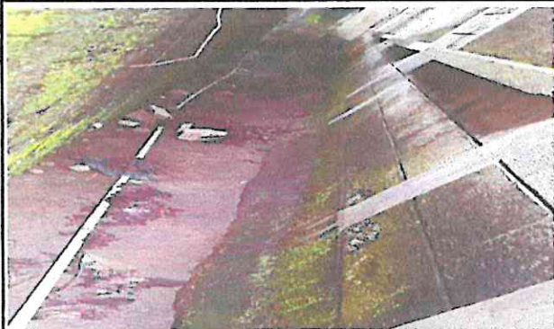
REPELLO E INPRIAMILISACION DE PARED PARA EVITAR FILTRACIONES AL LADO INTERIOR DE LA PARED