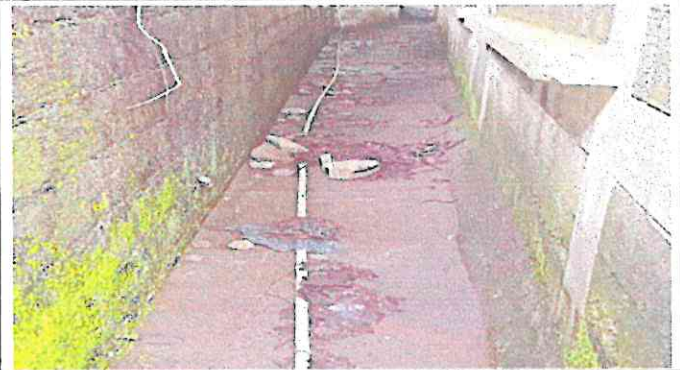
INSTALACION DE CUNETA DE CONCRETO PARA LIBERAR INUNDACION DE AGUA PLUVIA