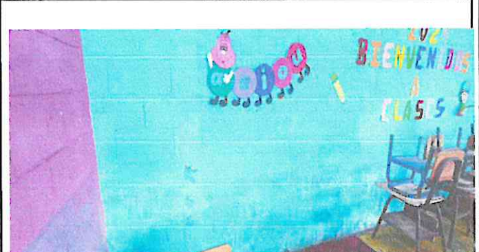
EVITAR FILTRACIONES DE UMEDAD EN PAREDES DEL EDIFICIO