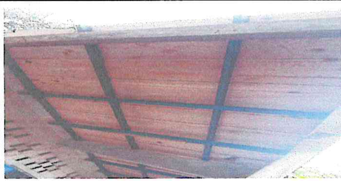
CAMBIO DE LAMIAN POR LAMINA TROQUELADA (MUCHAS GOTERAS Y FILTRACIONES)