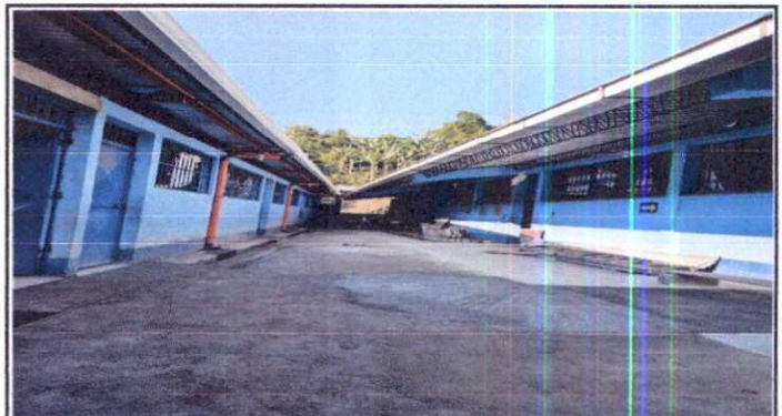
SUMINISTRO DE CANALES U-PVC EN 3 AULAS.