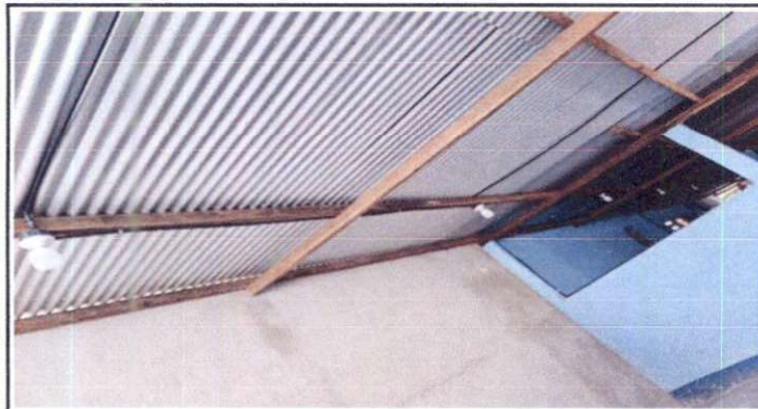
SUMINISTRO DE SISTEMA ELECTRICO.