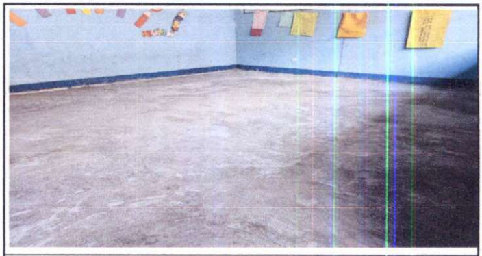
SUMINISTRO DE PISO DE CEMENTO EN 3 AULAS.

Observación: Si es necesario se pueden agregar hojas adicionales y actualizar el número de hojas.