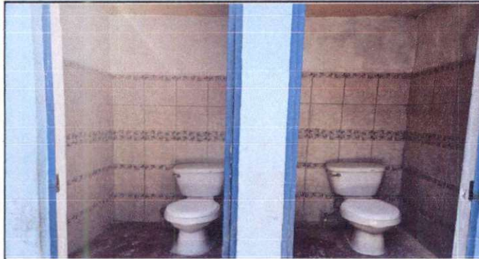
SUMINISTRO DE AZULEJO EN 8 SAITARIOS.