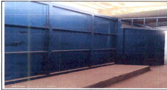
SUMINISTRO DE PUERTA Y REPARACIÓN DE PORTÓN.