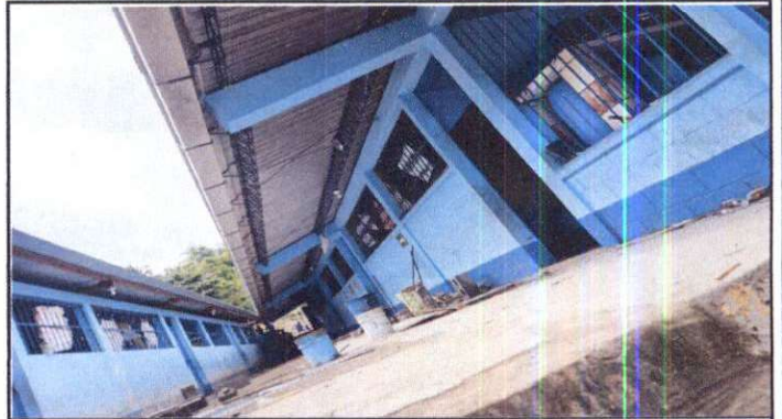
Suministro de torta de concreto.