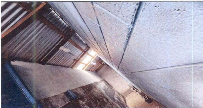
Aplicación de repello en paredes de bodega.