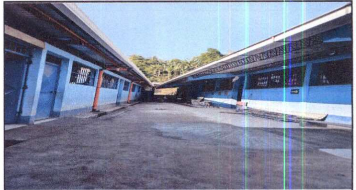
Suministro de canales y bajadas de agua pluvial.