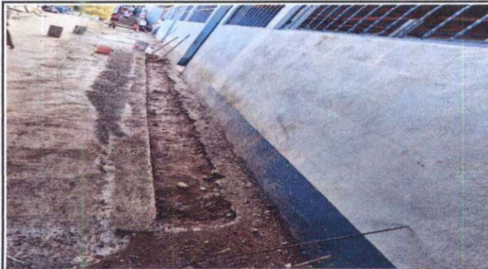
Cuneta de concreto.