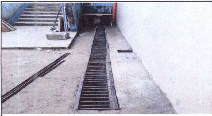
Cuneta de concreto y parrilla.