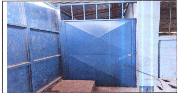
Suministro de puerta en bodega.

Observación: Si es necesario se pueden agregar hojas adicionales y actualizar el número de hojas.