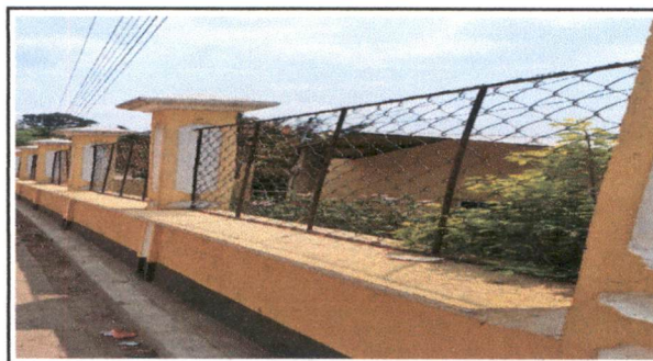
Pintura en muros interiores y exteriores

Observación: Si es necesario se pueden agregar hojas adicionales y actualizar el número de hojas.