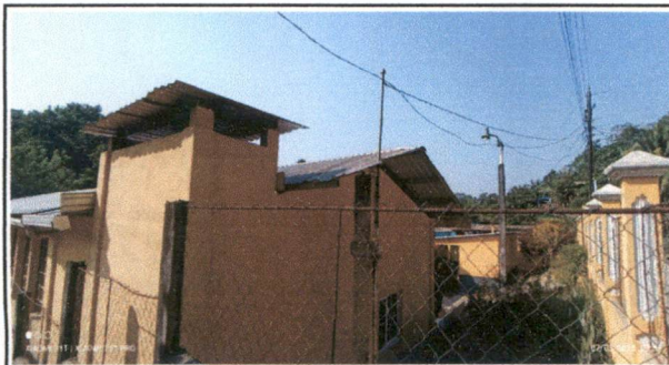
Pintura en muros interiores y exteriores