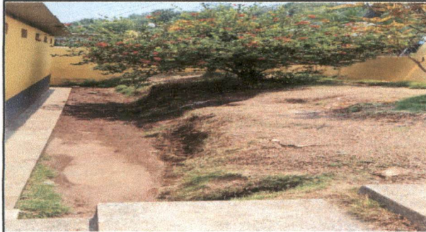
Levantado de muro para contener la erosión y evitar que colapse la tubería de agua potable.