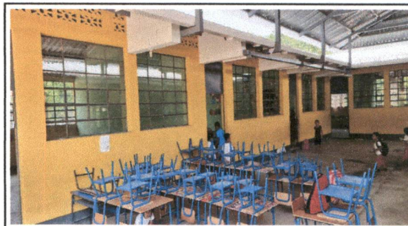
Pintura en muros interiores y exteriores