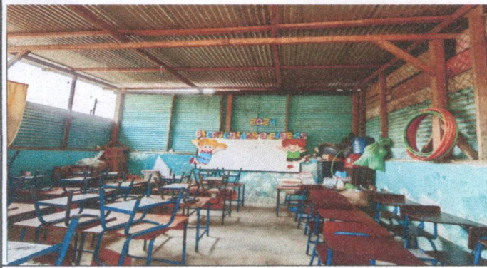
sustitución de 64m2 de soporte de madera a metal.