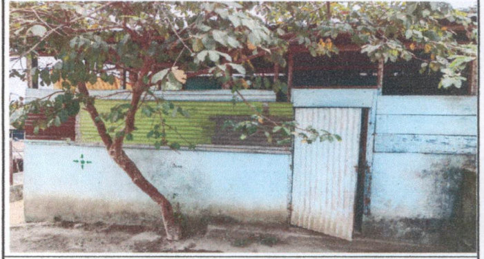
cambio de 24 ml de pared de lámina por bloc de cemento tayasal, sustitución de puerta de lamina de 1m X 2.10 mt a puerta de metal.