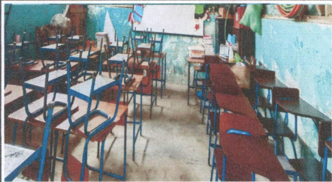
sustitución de 76mt2 de piso de torta de concreto a piso ceramico.