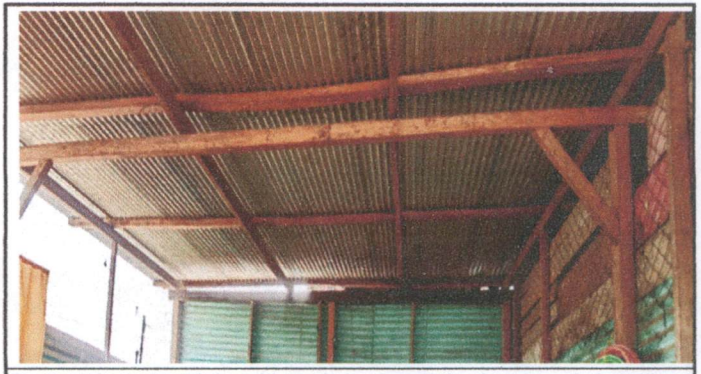
Sustitución de 64mt2 de cubierta de lamina por lamina troquelada calibre 26

Observación: Si es necesario se pueden agregar hojas adicionales y actualizar el número de hojas.