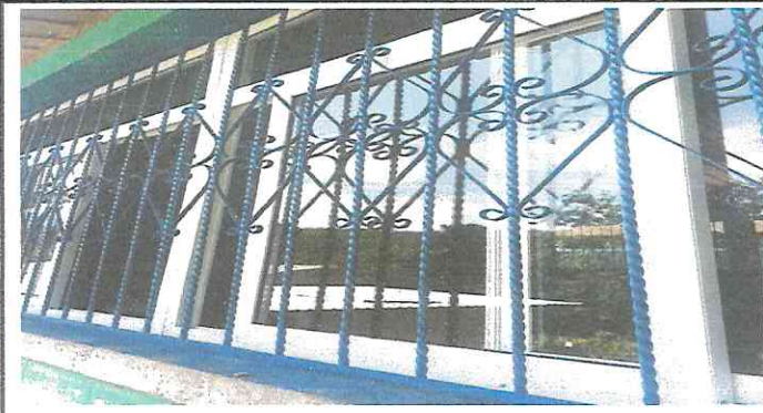
Foto1: INSTALACION DE VENTANAS