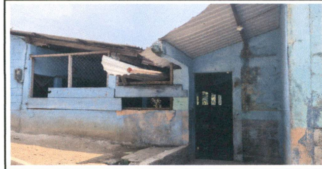
Sustitución de muro por portón de estructura metálica

Observación: Si es necesario se pueden agregar hojas adicionales y actualizar el número de hojas.