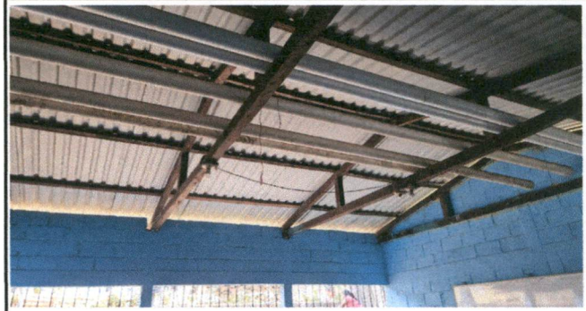
Sustitución de cubierta de lámina y estructura de soporte de madera por metal