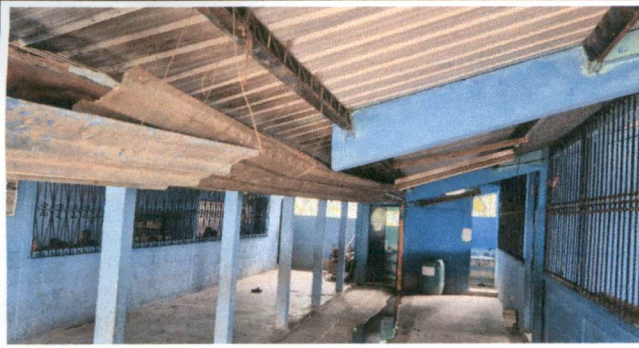
Sustitución de cubierta de lámina y estructura de soporte de madera por metal, sustitución de canal y bajada de agua pluvial