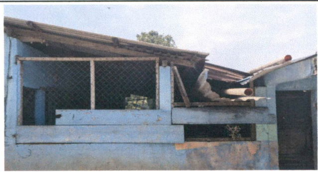
Sustitución de canal y bajadas de agua pluvial