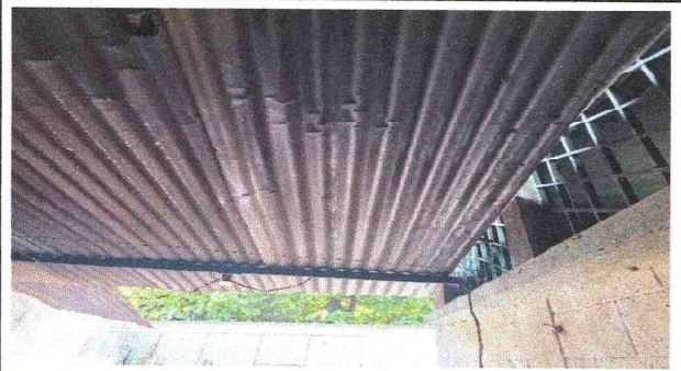
Sustitucion de estructura de soporte