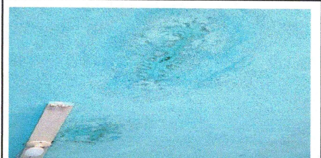
Impermeabilización de Loza

Observación: Si es necesario se pueden agregar hojas adicionales y actualizar el número de hojas.