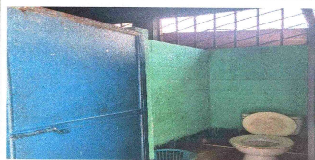
Sustitución de Inodoro