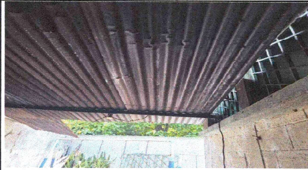
Cambio de lamina en cocina