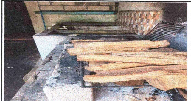
Mantenimiento a Estufa Rural