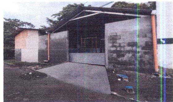
Foto 6: Sustitución de puerta de metal por portón de metal de 3.30 x 2.70 mts.

Observación: Si es necesario se pueden agregar hojas adicionales y actualizar el número de hojas.