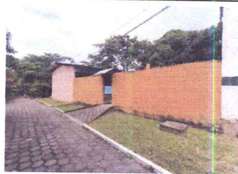
Foto 4: Suministro e instalación de block en muro perimetral. Repello de muro perimetral. Sustitución de banqueta de adoquín por losa de concreto.