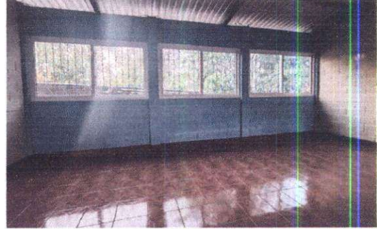
Foto 2: Sustitución de piso de cemento líquido por piso cerámico en aula. Suministro de ventanas de pvc blanco 1.36 x 2.30 mts. En aulas.