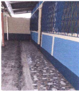
Foto 3: Sustitución de piso de torta de concreto por piso cerámico antideslizante en corredor. Pintura en muros exteriores e interiores.