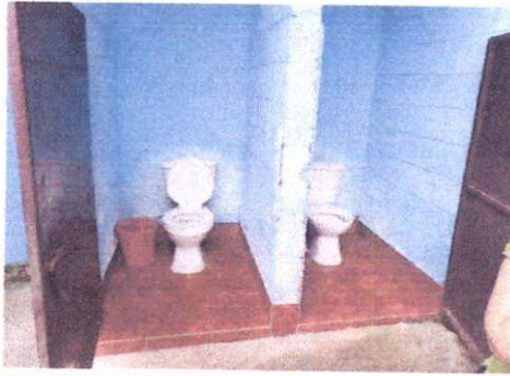
Foto1: Sustitución de accesorios inodoros.