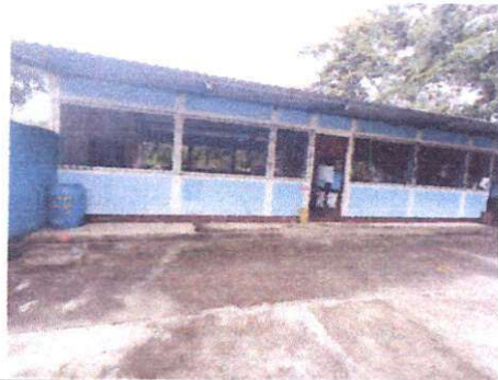
Foto 3: Sustitución de piso de torta de concreto por piso cerámico antideslizante en corredor. Pintura en muros exteriores e interiores.