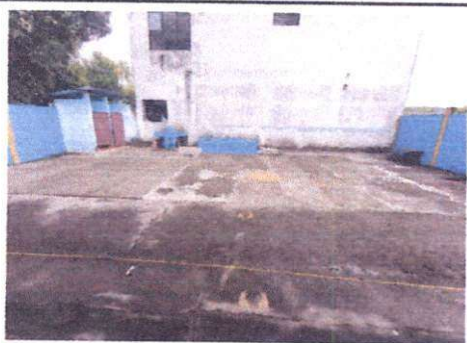
Foto 5: Reparación de losa de concreto de área recreativa de 9.10 x 14 mts. Suministro e instalación de lámina en área de patio. Suministro e instalación de estructura de soporte de metal en área de patio.