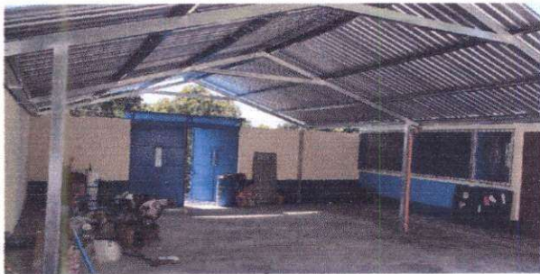
Foto 5: Reparación de losa de concreto de área recrearia de 9.10 x 14 mts. Suministro e instalación de lámina en área de patio. Suministro e instalación de estructura de soporte de metal en área de patio.