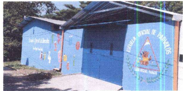
Foto 6: Sustitución de puerta de metal por portón de metal de 3.30 x 2.70 mts.

Observación: Si es necesario se pueden agregar hojas adicionales y actualizar el número de hojas.