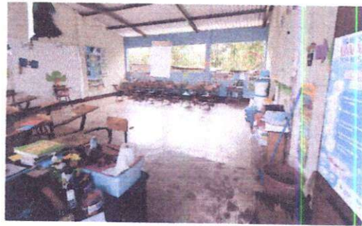
Foto 2: Sustitución de piso de cemento líquido por piso cerámico en aula. Suministro de ventanas de PVC blanco 1.36 x 2.30 mts. en aulas.