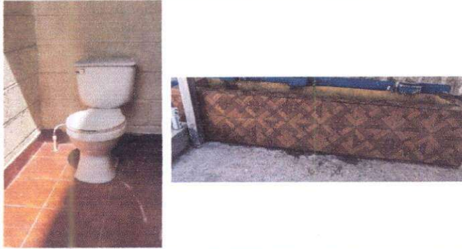
Foto1: Sustitución de accesorios inodoros.