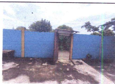
Foto 6: Sustitución de puerta de metal por portón de metal de 3.30 x 2.70 mts.

Observación: Si es necesario se pueden agregar hojas adicionales y se debe poner el número de hojas.