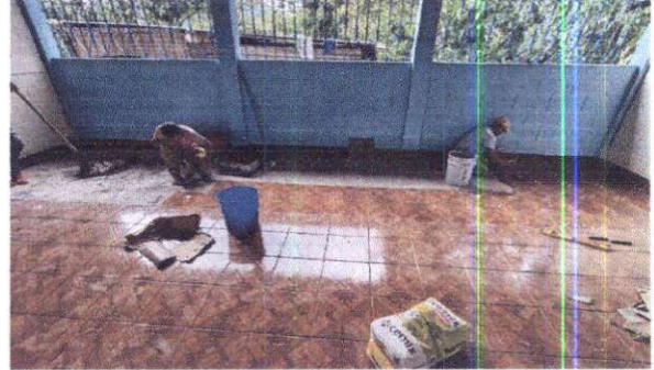
Foto 2: Sustitución de piso de cemento líquido por piso cerámico en aula. Suministro de ventanas de pvc blanco 1.36 x 2.30 mts. En aulas.