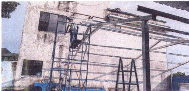
Foto 5: Reparación de losa de concreto de área recrearia de 9.10 x 14 mts. Suministro e instalación de lámina en área de patio. Suministro e instalación de estructura de soporte de metal en área de patio.