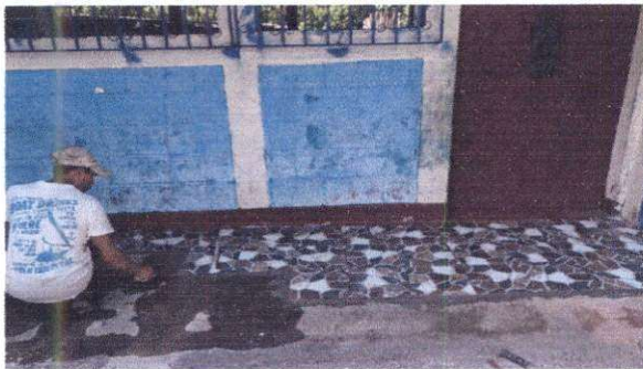
Foto 3: Sustitución de piso de torta de concreto por piso cerámico antideslizante en corredor. Pintura en muros exteriores e interiores.