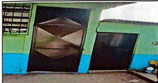
Mantenimiento de puertas de metal en aulas