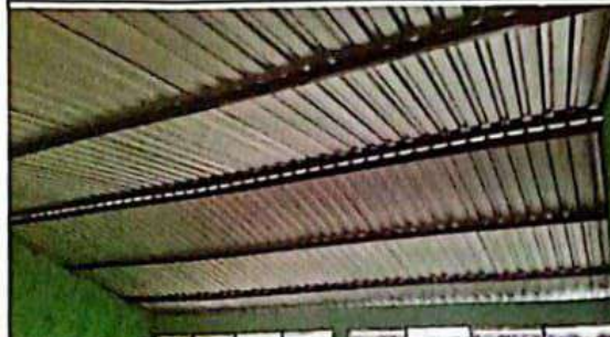
Sustitución de soporte tipo joist por costanera de metal