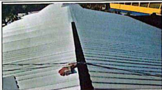
Sustitución de Cubierta de Láminas por láminas Troquelada