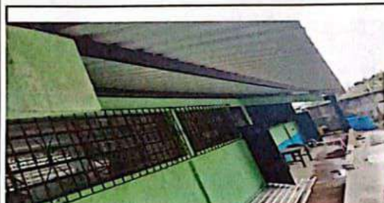
Mantenimiento de balcones de metal