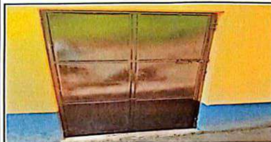
Sustitucion de puerta de metal en servicio Sanitario